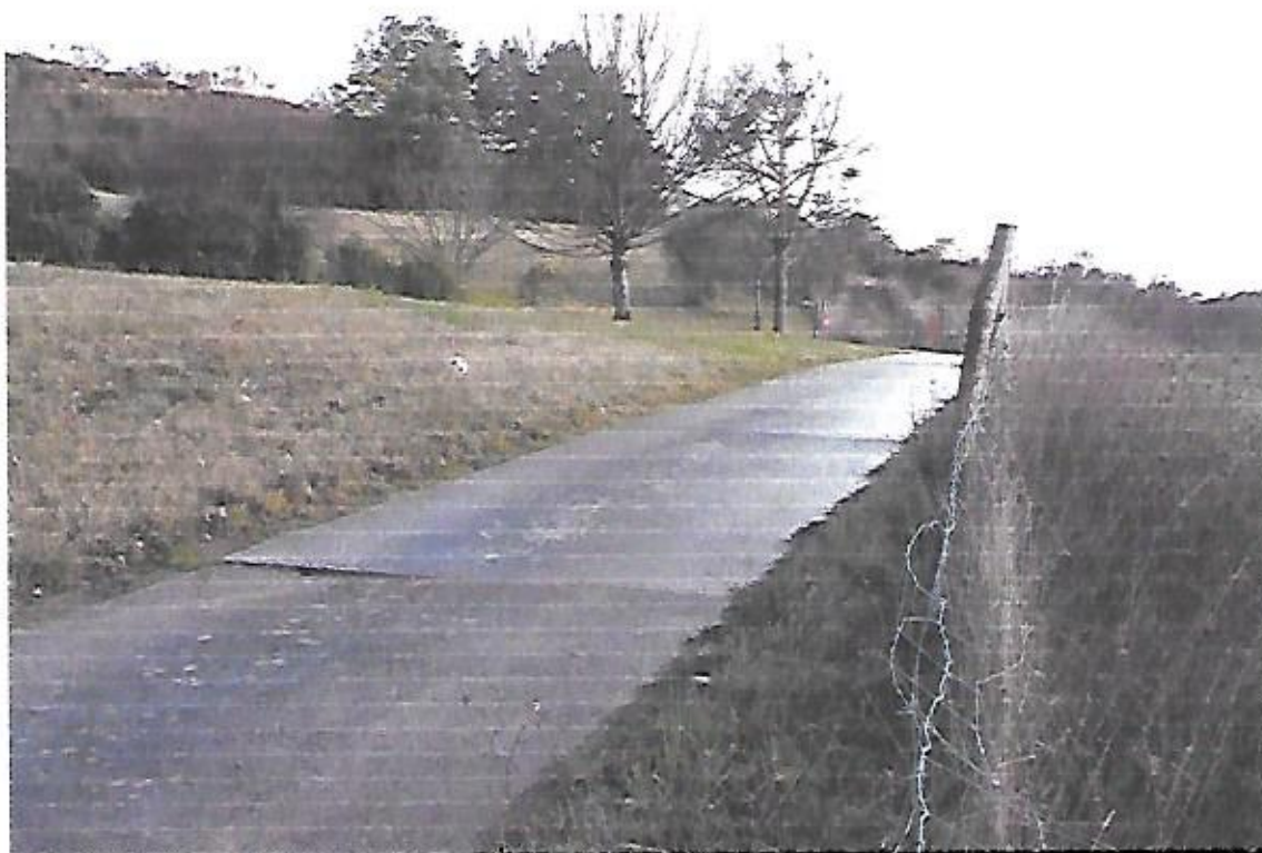
Vue de la partie du chemin communal dit "de service – Salazar" à déclasser.