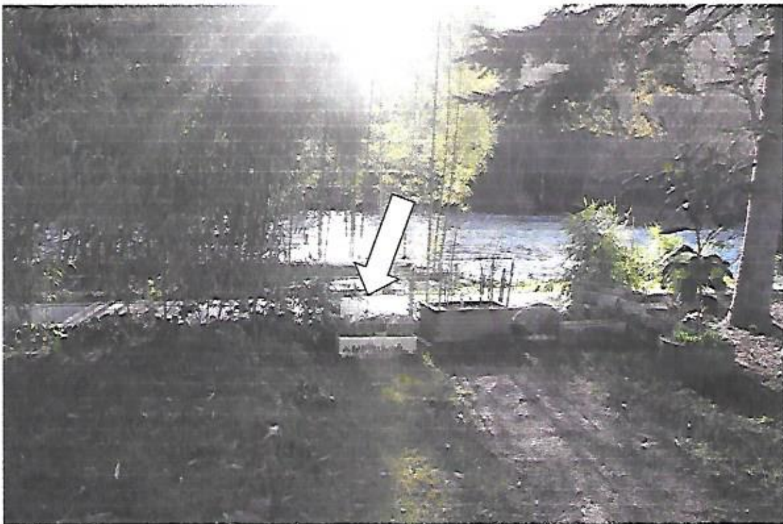
Vue rapprochée de la partie de la rue d'Occitanie à déclasser (déjà utilisée de fait par madame IZARD, Anne-Marie) Sentier pédestre le long de l'Aude créé par la commune