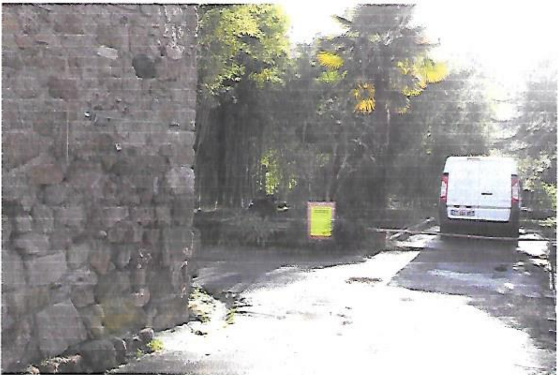
Vue de l'affichage de l'arrêté de mise en enquête publique au niveau de la partie de la rue d'Occitanie à déclasser.