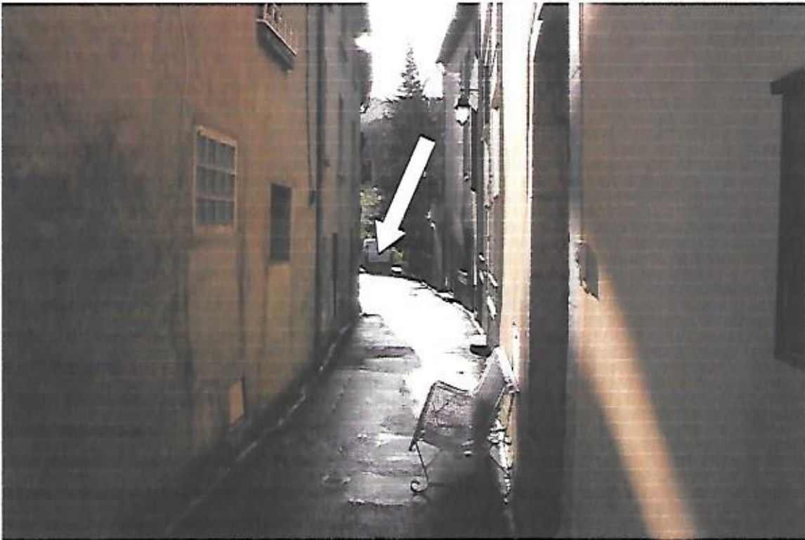
Vue de la rue d'Occitanie dans le village de Campagne sur Aude. La flèche indique la partie de la rue à déclasser.