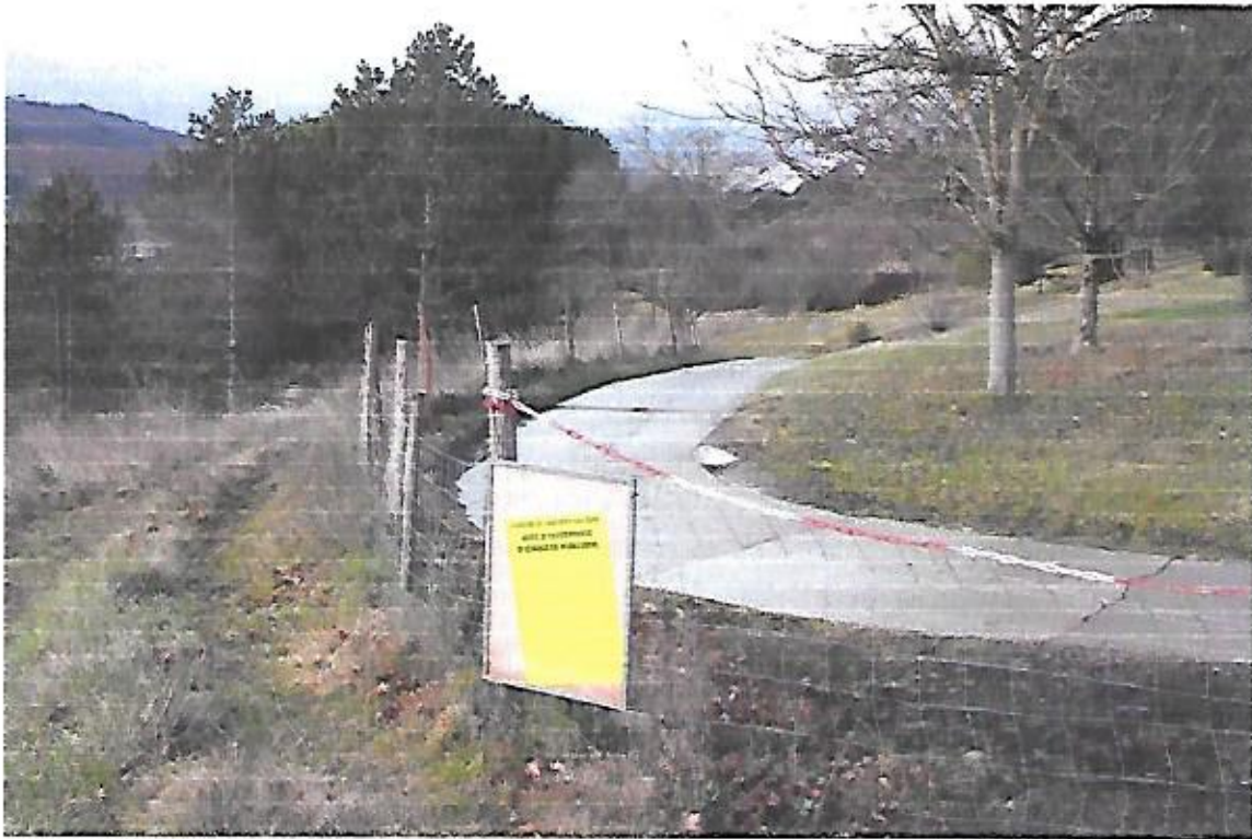
Vue de l'affichage de l'arrêté de mise en enquête publique au niveau de la partie du chemin communal dit "de service – Salazar" à déclasser. .