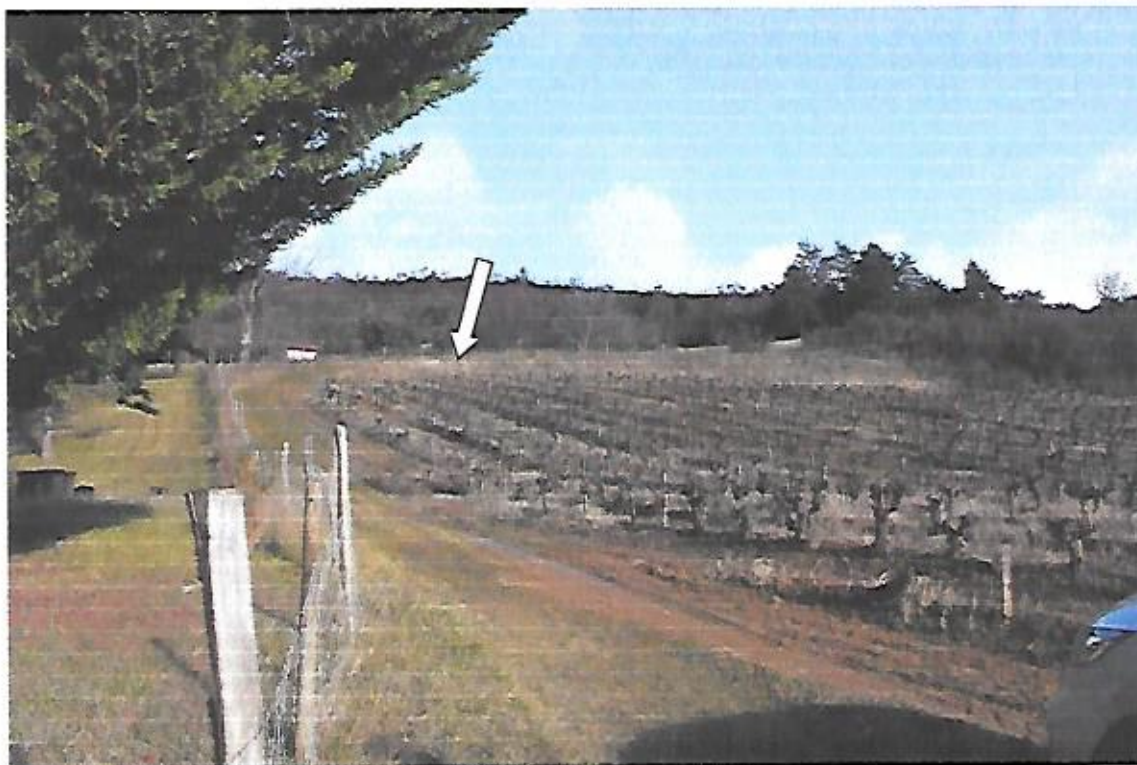
Vue prise de la parcelle AK136 en direction du chemin communal dit "de service – Salazar" dont la flèche indique l'emplacement.