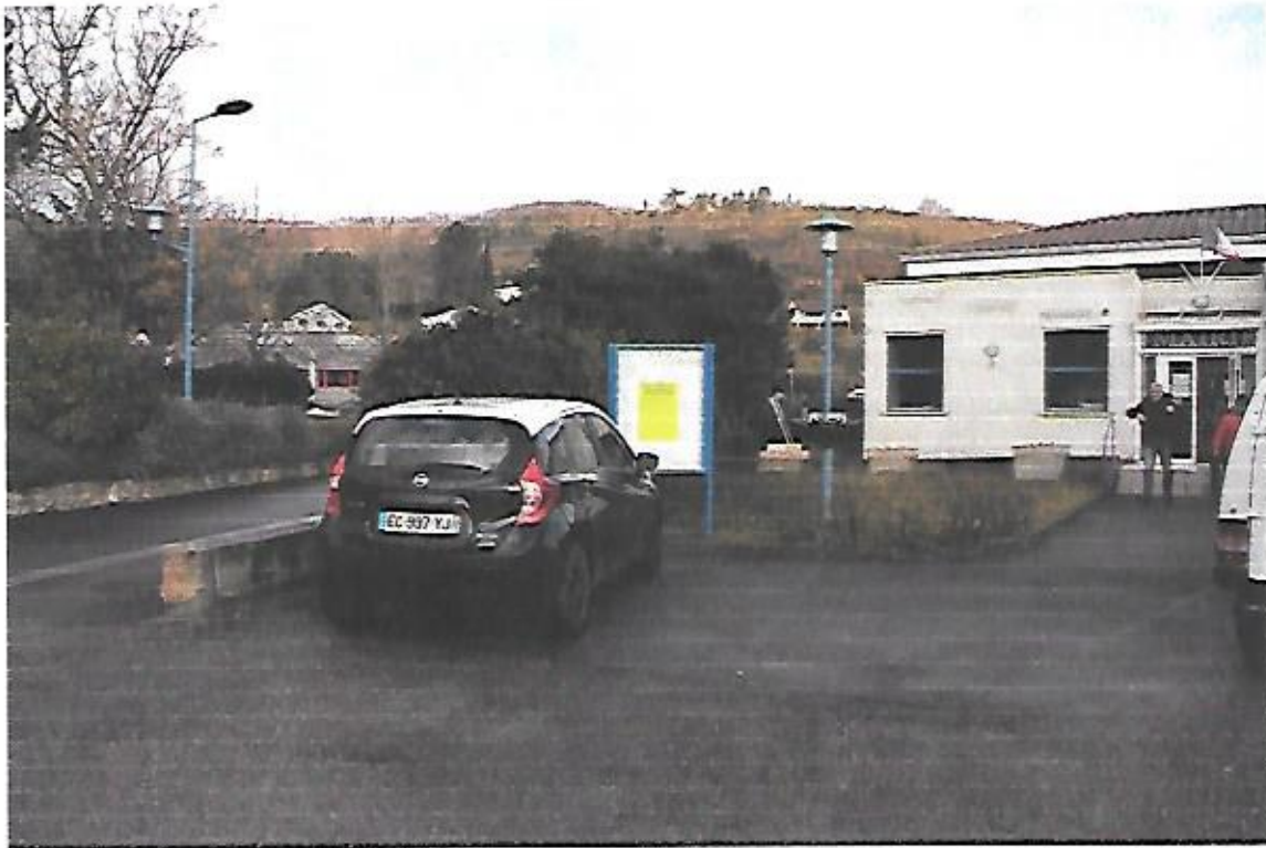
Vue du panneau d'affichage situé à proximité du parking de la mairie de campagne sur Aude.